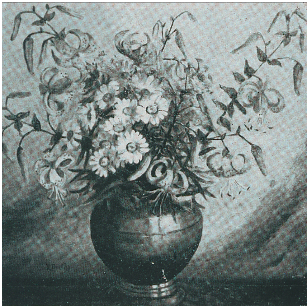
Ryc. 6 E. Prielipp, Tigerlilien (fot. za: Ausstellung 1941)