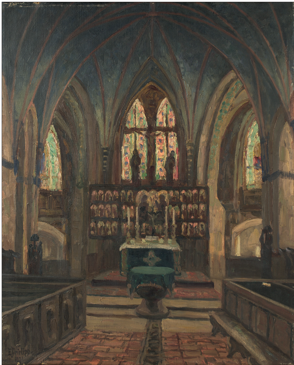
Ryc. 2 E. Priellipp, Wnętrze prezbiterium kościoła św. Jana Chrzciciela, olej na płótnie. Zbiory MAH w Stargardzie, nr inw. MS/S/1140.