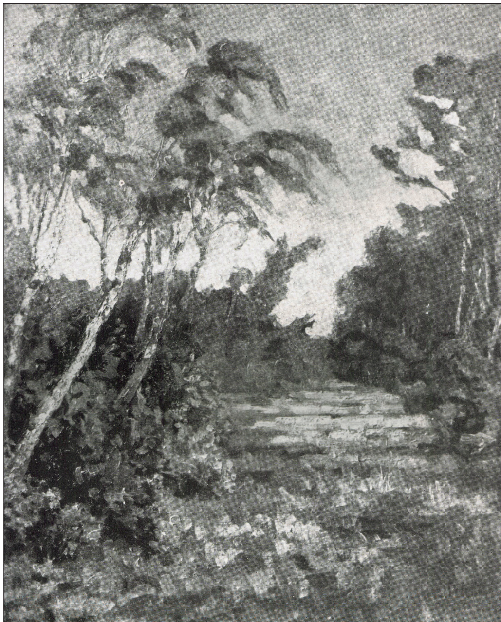
Ryc. 5 E. Prielipp, Wald an der Kurischen Nehrung