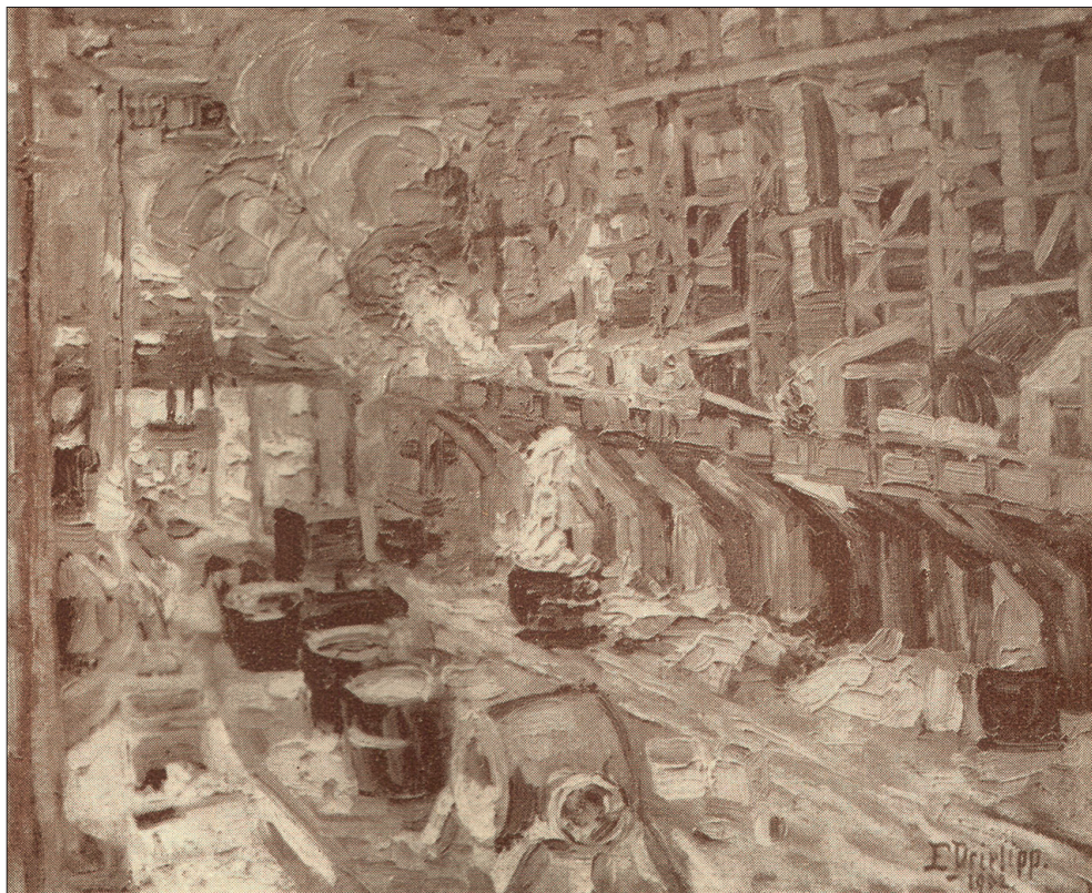
Ryc. 8 E. Prielipp, Hochofen