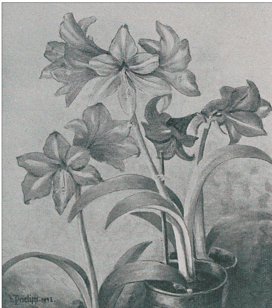
Ryc. 7 E. Prielipp, Amaryllen