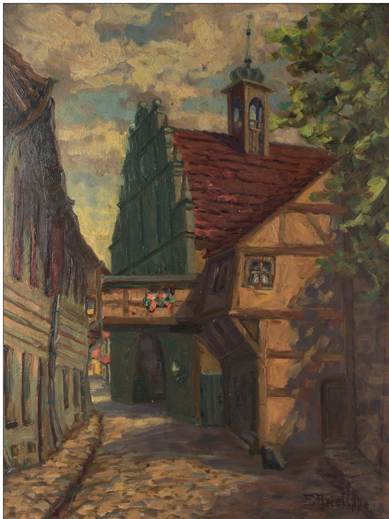
Ryc. 1 E. Prielipp, Zaułek przy Bramie Wałowej, olej na tekturze, 1931 r. Zbiory MAH w Stargardzie, nr inw. MS/S/1137.