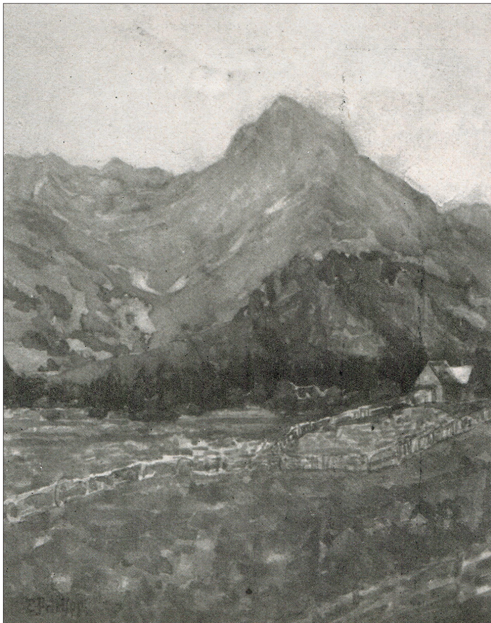
Ryc. 3 E. Prielipp, Rubihorn bei Fischen